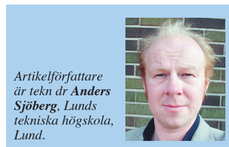
Artikelförfattare är tekn dr Anders Sjöberg, Lunds tekniska högskola, Lund.

ttersom metoden bygger på att RF-profilen mäts över hela hålets djup behöver inte heller något foderrör monteras i borrhålet. Detta är två markanta förenklingar i arbetsutförandet som skiljer sig från normala borrhålmätningar. Vanligtvis måste mäthållet borraras och fodras tre dagar innan monteringen av givaren kan ske, enligt www.rbk.nu . Denna förenkling innebär att mättekniker som använder OE-metoden bara behöver åka ut till mätplat-